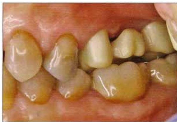
Fig. 3 Diseño de la estructura.

Una vez obtenidas las infraestructuras de las restauraciones y antes de colocar la cerámica de revestimiento, se procedió a realizar la prueba en clínica de las mismas (fig. 5). En esta fase se comprobó el ajuste marginal, el ajuste de la estructura, el espacio protésico para la cerámica de revestimiento, y el grosor y forma de los pónicos.