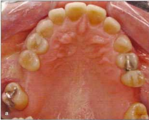
Fig.1 a-e Estado inicial de la paciente.