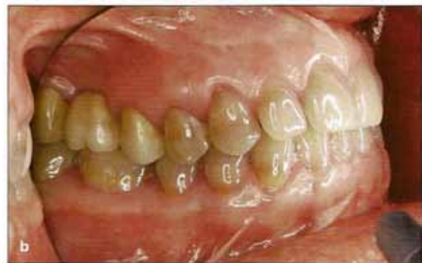
Fig. 7 a y b Prótesis cementadas.