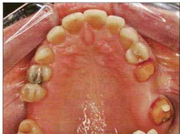
Fig. 2 Aspecto de la preparación de pilares.

Tras la obtención de las impresiones, se colocaron las restauraciones provisionales. Para la toma de color se utilizaron colores de esmalte y dentina individualizados debido a la tinción por tetraciclinas que presentaba la paciente. Para ayudar al técnico en la caracterización de las